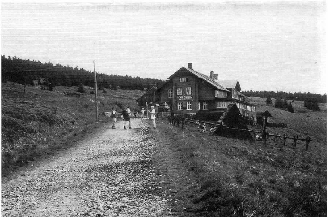
Schweizerei am Großen Schneeberg des Glatzer Schneegebirges am 27.05.1999

Am 27.05., nach gut 3,5 Stunden, erreichten wir von Wölfelsgrund, vorbei an der Schweizerei, der Marchquelle, den Gipfel unseres höchsten Grafschafter Berges, den Großen Schneeberg (1425m), bei idealen Wetterverhältnissen. Der gewohnt phantastische Rundblick von den gesprengten Trümmern des Kaiser-Wilhelm-Turmes, "onnsern Schneebarchtorme", führte uns im Westen ins große breite Neißetal mit dem Adler - und Habelschwerdter Gebirge im Hintergrund, weiter nördlich ins Heuscheuergebirge, nach Osten ins Reichensteiner - und Bielengebirge. Ostwärts unseres Standortes erstreckt sich in ca. 30km Luftlinie unser etwas höherer Nachbar das Altvatergebirge mit dem Altvater (1491m) als höchstem Berg.