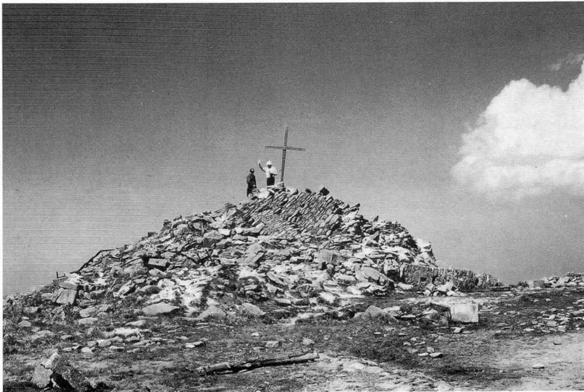
Der am 13.10.1973 von Polen gesprengte Kaiser-Wilhelm-Turm vom Gr.Schneeberg am 27.05.1999