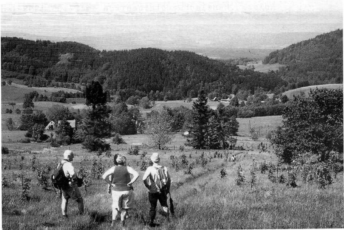
Auf dem Weg zu den Neißequellen. Blick auf Neißbach und obere Grafschaft.

Der 30. Mai, die bewährte Schneeberg-Wandergruppe, bricht auf zur Erkundung der Neißequellen. Busfahrt bis vor Neißbach. Aussteigen und Aufsteigen zum 900m hohen Eschenberg, dem Quellgebiet der Neißequellen.