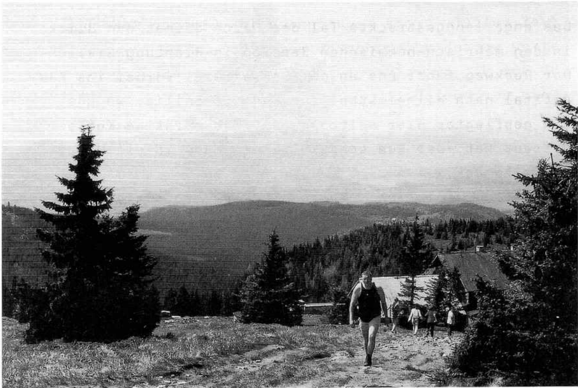
Schweizer - Grafschafter Talebene - Adler-u.Habelschwerdtergebirge am 27.05.1999