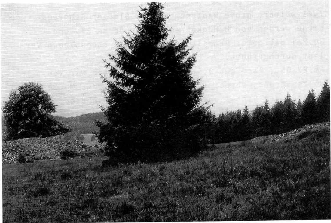
Heidelberg (700m) 4 km nordostwärts Bad Landeck