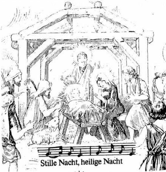
Stille Nacht, heilige Nacht

Nun, die Tage werden kürzer, das Jahr neigt sich dem Ende zu. Darum möchte ich hier die Gelegenheit nutzen, allen Lesern dieser GGV-Mitteilung ein gesegnetes, friedvolles Weihnachtsfest und ein gutes, gesundes und erlebnisreiches Jahr 2000 zu wünschen.