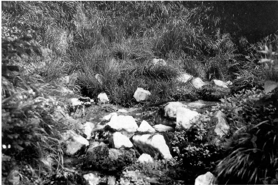
Die zwei südlichen Neißquellen am Eschenberg am 30.Mai 1999

Um sicher und zweifelsfrei unser Ziel zu erreichen wählen wir nach ca. 200m ostwärts Neißbach den Weg unmittelbar an der Neiße bergwärts durch Wald und Gestrüpp. Nach knapp 200m teilt sich die Neiße in ein südliches und nördliches Bächlein, die beide voneinander bis zu 100m in der Breite zu Tale drängen. Wir steigen weiter am südlichen Wasser entlang und erreichen in bis zu 200m Entfernung die südlichen Quellen. Frisches, kristallklares Quellwasser aus der Tiefe des Eschenberges drängt beiderseits einer stämmigen Fichte ans Tageslicht und vereinigt sich nach etwa zwei Metern in ein zu Tale springendes Bächlein.