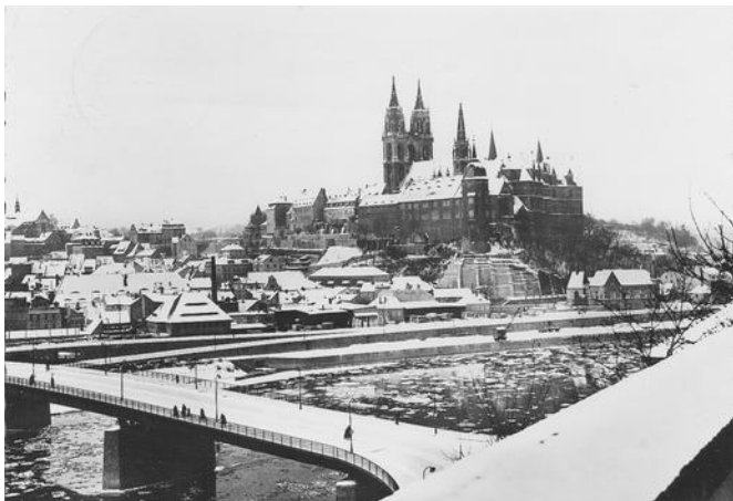
Auf der verschneiten Elbebrücke in Meißen beobachtete ich das Malheur mit den Weihnachtsstollen.

Auf meinem Heimweg von der Arbeit kam mir eines Abends auf der Elbebrücke ein Mann entgegen, der auf der Schulter ein Kuchenbrett trug, auf dem vier oder fünf große Stollen lagen. Er kam gewiß aus einer der Backstuben, und zu Hause wartete die restliche Familie auf die weihnachtliche Köstlichkeit. Die Stollen waren schwer, das Brett muß ihn wohl stark auf die Schulter gedrückt haben. Ich sah, wie er das Brückengeländer nutzen wollte, um die Last auf die andere Körperseite zu verlagern. Er setzte das Brett ab, drehte sich etwas zur Seite – da kam einer der Stollen ins Rutschen. Sofort versuchte der Mann, nun wenigstens die übrigen zu retten.