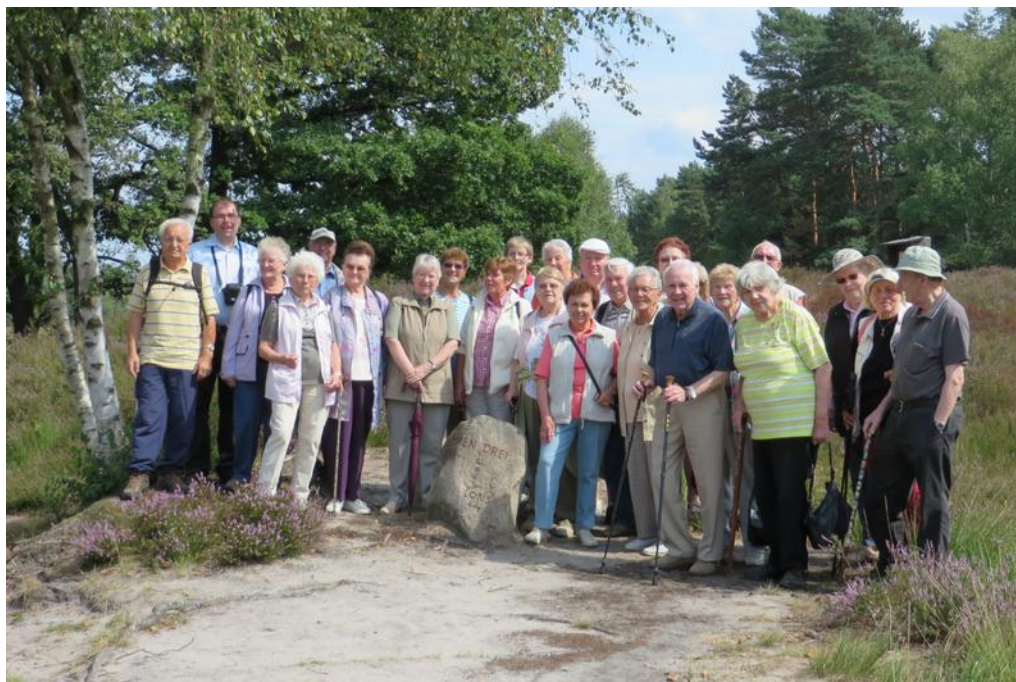
Unsere Wandergruppe zur Heideblüte in der Gifhorner Schweiz bei Winkel

Bitte besuchen Sie unsere Heimatstube Kreuzstraße 42, 38118 Braunschweig. Sie ist (fast) jeden 1. und 3. Sonntag im Monat von 14 bis 17 Uhr geöffnet.