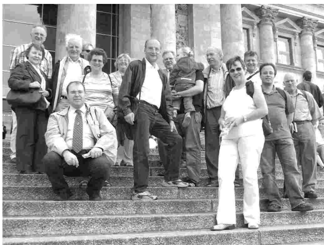
Vor dem Reichstagsgebäude in Berlin