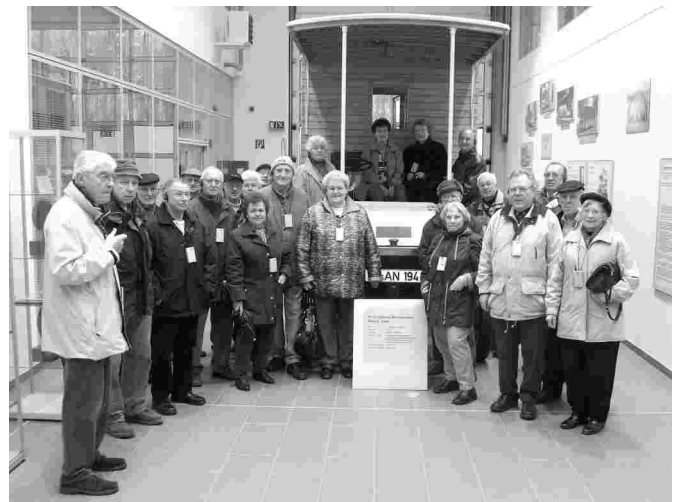
Werksbesichtigung bei der Firma MAN