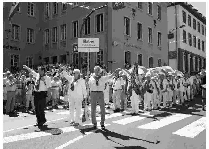
GGV beim Deutschen Wandertag

Diesen freiwilligen und ehrenamtlichen Wanderführern/innen danke ich für ihre Bereitschaft, uns Mitgliedern ihre Zeit zu schenken. Die Herausforderung, sich jeweils ein Jahr vorher Gedanken über das Wanderziel, die Organisation vom Parkplatz bis zur Stätte der Einkehr zu machen, ist ein Zeichen für eine lebensbejahende, positive Einstellung. Wer sich für andere stark macht, steigert auch seine eigene Lebensqualität. Das sollte auch Ansporn für weitere Mitglieder/innen sein, uns zukünftig mit Wanderangeboten zu unterstützen. Durch die lange Vorlaufzeit ist es durchaus möglich und verständlich, wenn eine geplante Wanderung gleich aus welchen Gründen nicht durchgeführt werden kann. Für diesen Fall wird der Verein Ersatz stellen.