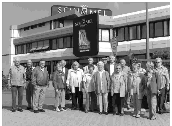
Besichtigung der Klavierfabrik Schimmel