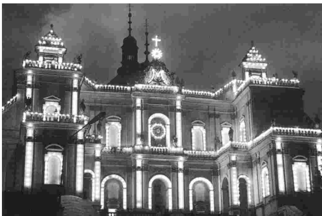
Illumination der Wallfahrtsbasilika in Albendorf

Das Quartier werden wir in einem Hotel am Kurpark in Bad Altheide haben.