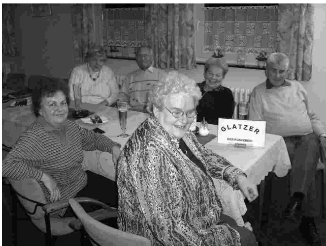
Am Stammtisch des Glatzer Gebirgs-Vereins

Der Glatzer Gebirgs-Verein hat einen neuen Stammtisch für seine Mitglieder und interessierten Gäste eingerichtet. Wir treffen uns an jedem dritten Mittwoch im Monat ab 18.00 Uhr in der Gaststätte „Rote Wiese“ in Braunschweig, Rote Wiese 9. Die Zufahrt mit dem Pkw erfolgt über den „P+R“-Parkplatz an der Salzdahlumer Straße (neben der ARAL-Tankstelle). Die Anfahrt ist auch mit den Buslinien 411, 422, 431 und 439 möglich bis zur Haltestelle „Holzmindener Straße“, dann zu Fuß über die Holzmindener und Braunlager Straße.