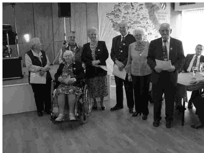
Ehrung der langjährigen Mitglieder (siehe Seite 2)